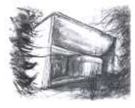
SS. Filippo e Giacomo