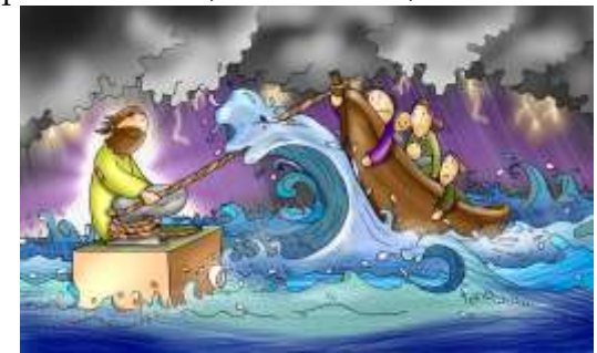
Perché avete paura? Non avete ancora fede?

Ci fu una grande tempesta di vento e le onde si rovesciavano nella barca, tanto che ormai era piena. Egli se ne stava a poppa, sul cuscino, e dormiva. Allora lo svegliarono e gli dissero: «Maestro, non t'importa che siamo perduti?».