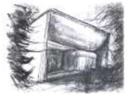
SS. Filippo e Giacomo